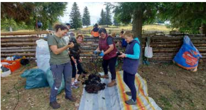
Menina planina, Poletno striženje ovac

Sodelovale so v jutranji televizijski oddaji Dobro jutro Slovenija v programu SLO 1 z naslovom Povabilo na 50. dneve narodnih noš in festival oblačilne dediščine v Kamniku.