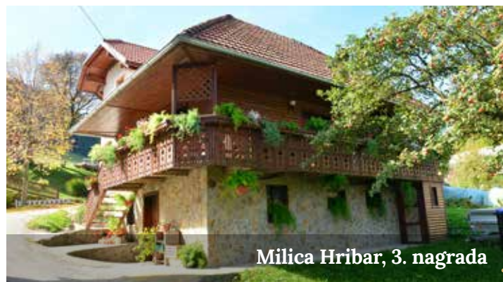
Milica Hribar, 3. nagrada