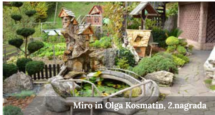
Miro in Olga Kosmatin, 2. nagrada