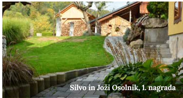
Silvo in Joži Osolnik, 1. nagrada